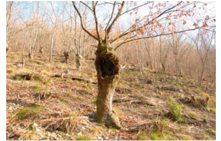
写真3 黒川奥瀧谷の台場クヌギ

猪名川上流域でのクヌギ林の萌芽更新は、地際より高さ0.5～2mで幹を伐って、高い切り株（台）を作り、その台から発生した萌芽幹を約10年で伐採・利用を繰り返すという、台場クヌギ（写真3：参照）と呼ばれ、日本森林学会の林業遺産に登録されています。