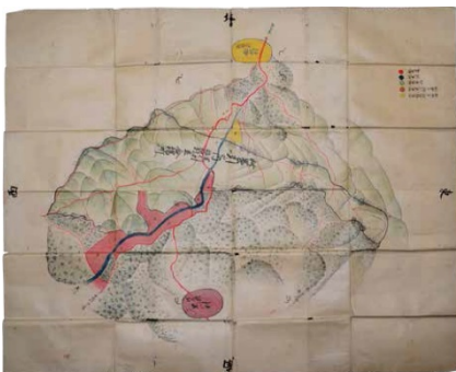
写真1 稲地村と山論、立会絵図

黒川では日本一の里山林と同時に自然林の照葉樹林、夏緑樹林を見ることができます。妙見山の麓にある八幡神社の照葉樹林と山頂の夏緑樹林という2つの自然林の存在によって二次林である「日本一の里山林」の特徴がより鮮明に映し出されます。