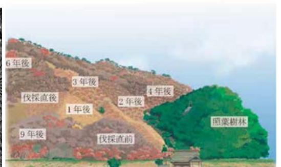
図1 パッチワーク状植生景観