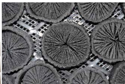
写真2 一庫炭の断面（菊花状）