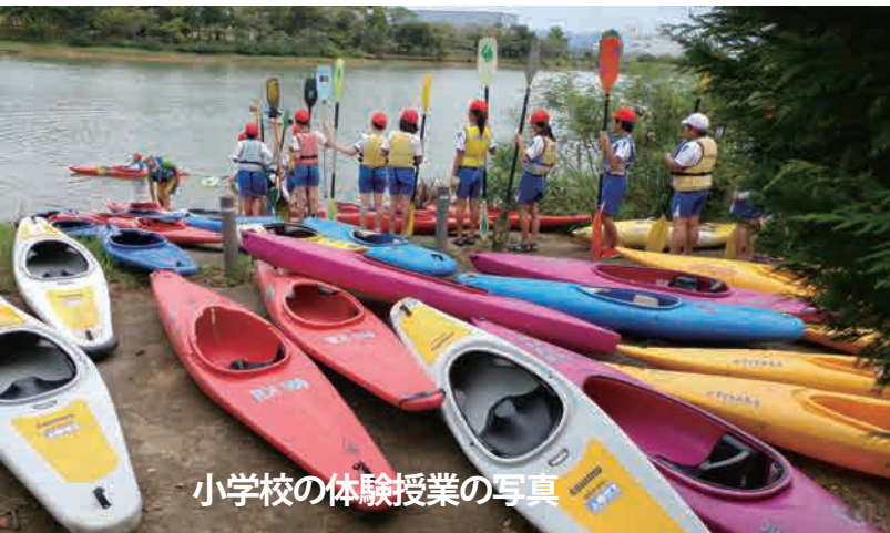
小学校の体験授業の写真