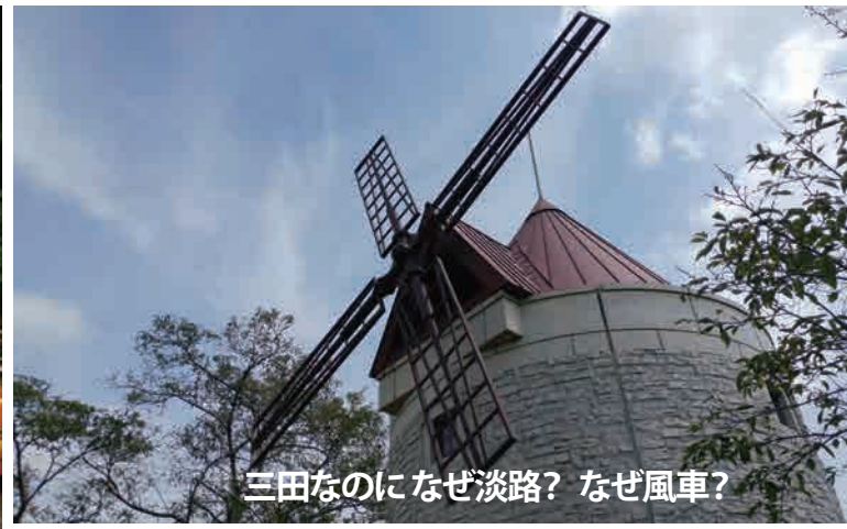
三田なのになぜ淡路？ なぜ風車？