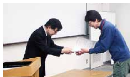
修了式 記念品の贈呈