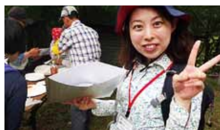
里山でおもてなし