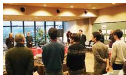
親睦を深める交流会