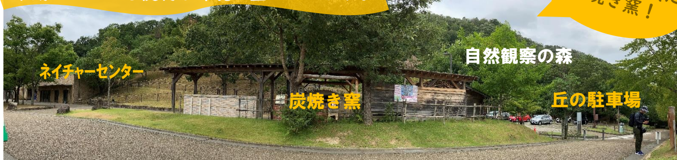
ネイチャーセンター