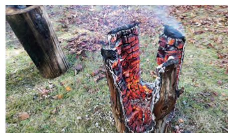
ウエルカムイベントも