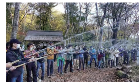
伐採竹で水鉄砲づくり