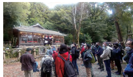
歴史や文化に触れることもできる