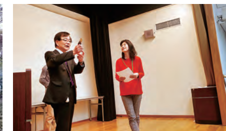
修了記念品の贈呈